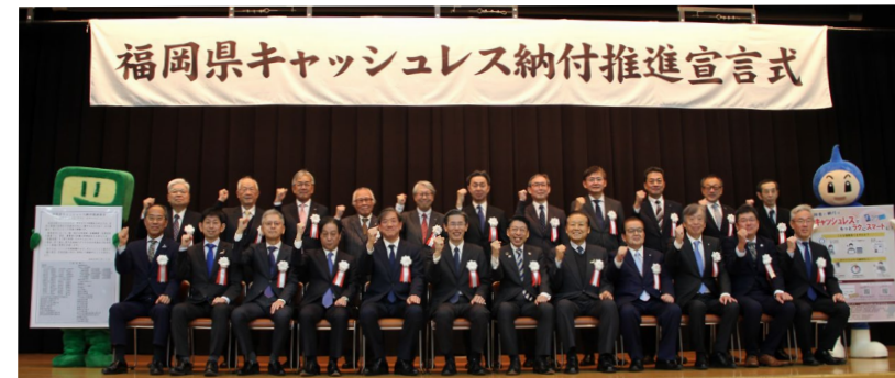
福岡県キャッシュレス納付推進宣言式 (令和8年2月10日(火)開催)