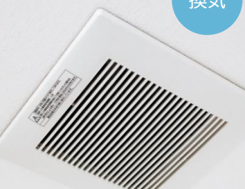
換気機能付エアコン設置工事