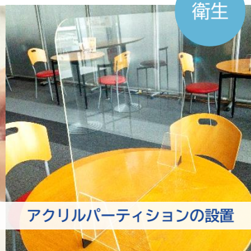
アクリルパーティションの設置