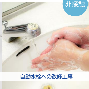
自動水栓への改修工事