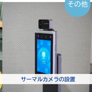
サーマルカメラの設置